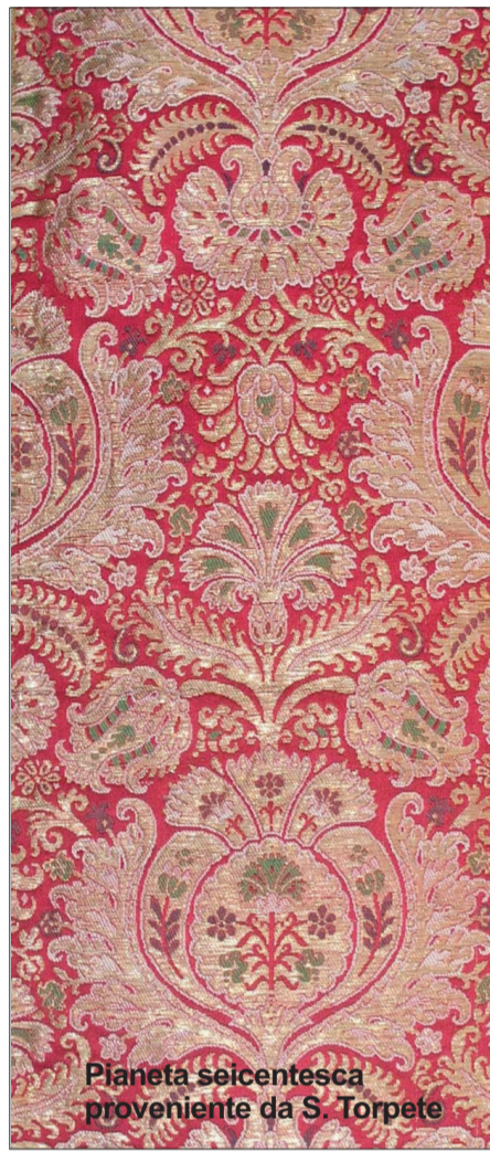
Pianeta seicentesca proveniente da S. Torpete

Genova è da sempre una città aperta, verso il mare, ma anche verso nuove cul-